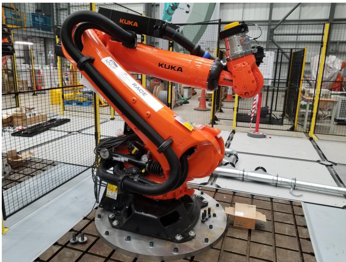
Figura 1. Braço mecânico robô Kuka KR 210 R3100 ULTRA KRC4

O Robô Industrial KUKA KR 210 R3100 ULTRA KRC4 é um equipamento de automação projetado para realizar uma variedade de tarefas industriais com eficiência e precisão. Sendo constituído de um braço mecânico, painel elétrico de comando e uma unidade de controle e programação, que são interligados para seu devido funcionamento e desempenho, (Figura 1 e 2).